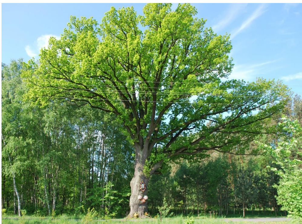
Fot. 1 Pomnik przyrody gat. dąb szypułkowy wiosną

W kwietniu 2016 r. wykonano zabiegi mające na celu utrzymanie dobrego stanu zdrowotnego oraz niwelowanie potencjalnie pojawiających się zagrożeń ze strony patogenów.