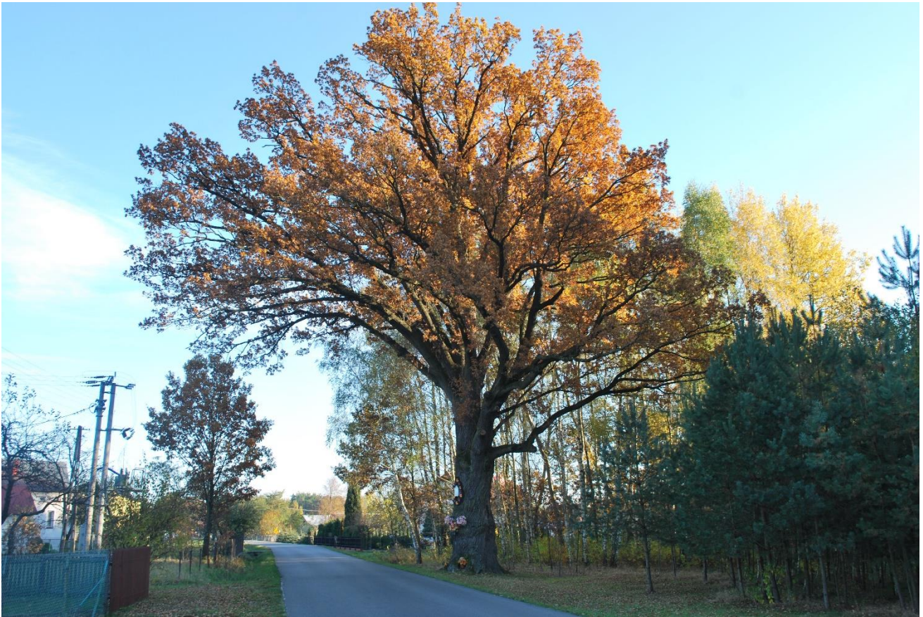
Fot. 2 Pomnik przyrody gat. dąb szypułkowy jesienią