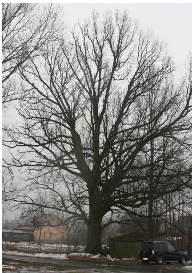
Fot. 1 Pomnik przyrody gat. dąb szypułkowy zimą

Jesienią 2017 r. planuje się przeprowadzić zabiegi pielęgnacyjne, prowadzące do usunięcia posuszu z korony. Wpłyne to zarówno na walory estetyczne pomnika przyrody, jak i bezpieczeństwo osób znajdujących się w jego obrębie oraz ruchu drogowego.