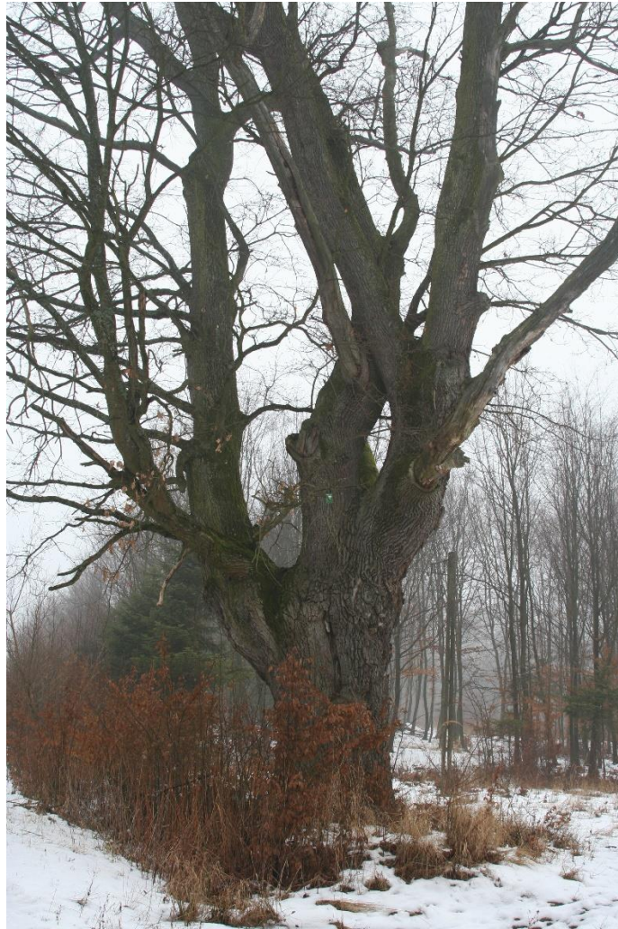
Fot. 2 Pomnik przyrody gat. dąb szypulkowy zimą