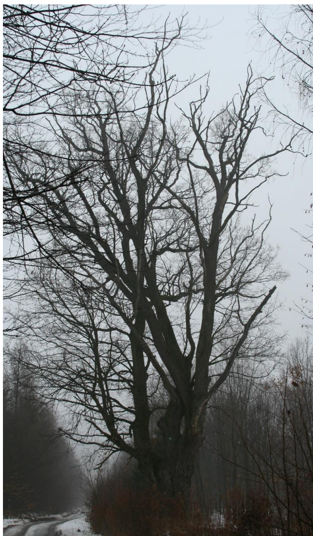
Fot. 1 Pomnik przyrody gat. dąb szypułkowy zimą

Ze względu na występujący w koronie posusz, planowane jest przeprowadzenie zabiegów pielęgnacyjnych i technicznych jesienią 2017 r.